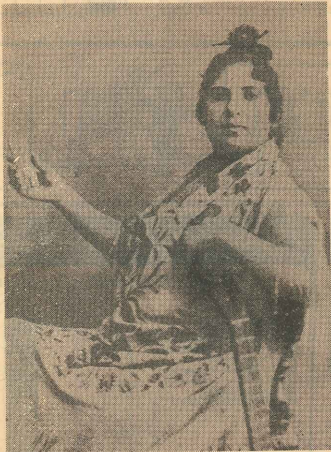
Pepa de Oro, de quien Chacón aprendió los cantes de ida y vuelta

Por lo que respecta a los estilos de Levante, señala Blas Vega que Chacón llegó a La Unión hacia 1896, invitado por Rojo el Al-